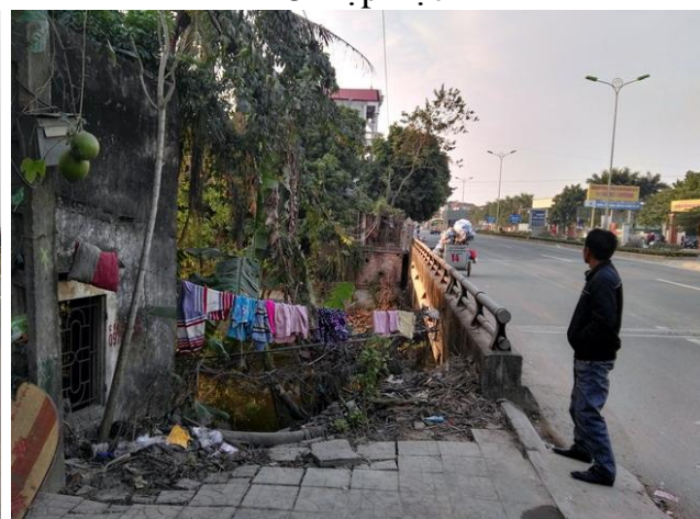
LS15 Cầu Tiên Châu