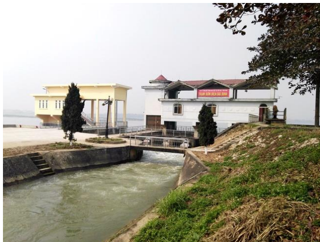
LS3 Trạm bơm Đại Định