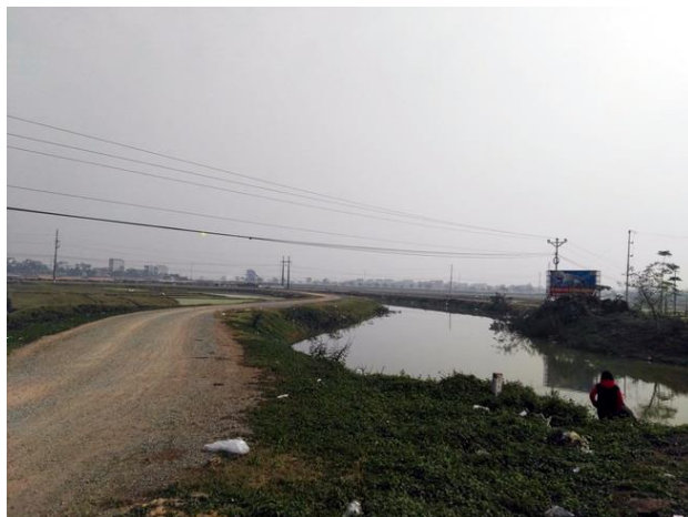
LS10 Cầu Thượng Lập