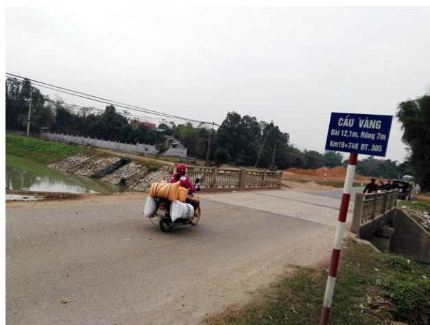
LS9 Cầu Vàng