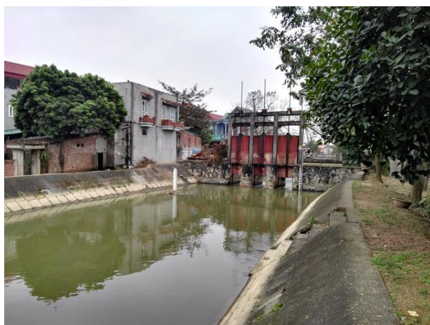
LS4 Cổng Vân Tập