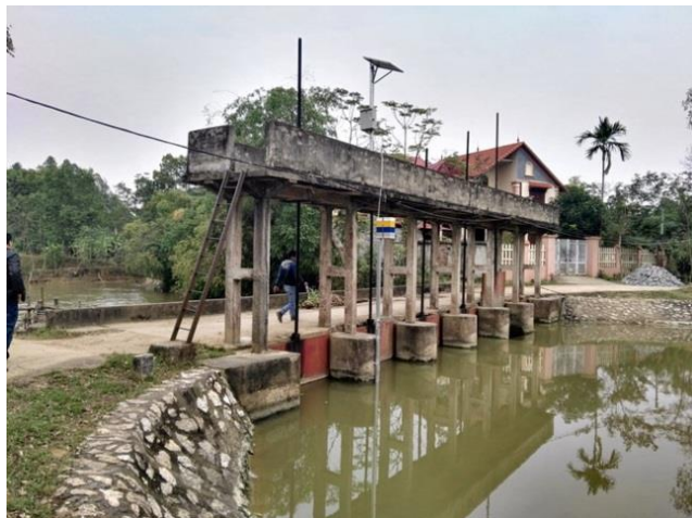
LS13 Đập Lạc Ý