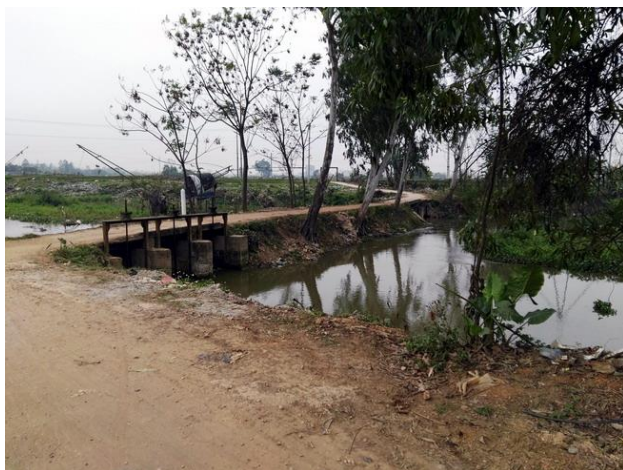
LS12 Đập Vĩnh Sơn