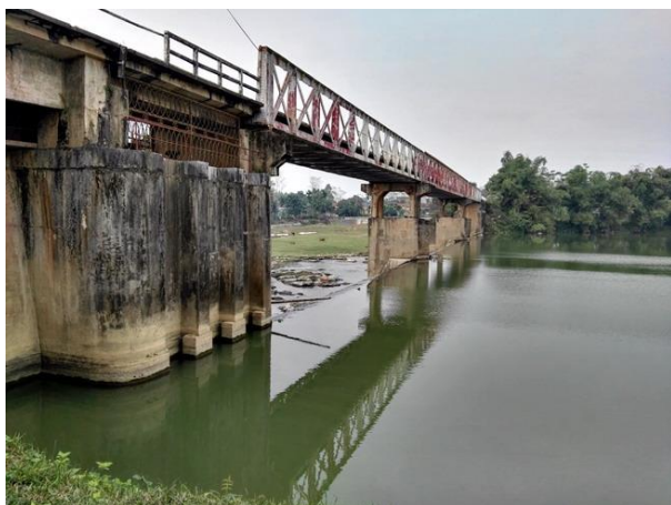
LS1 Đầu mối đập Liễn Sơn