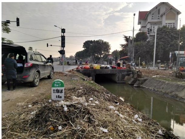
LS6 Cống Nguyệt Đức