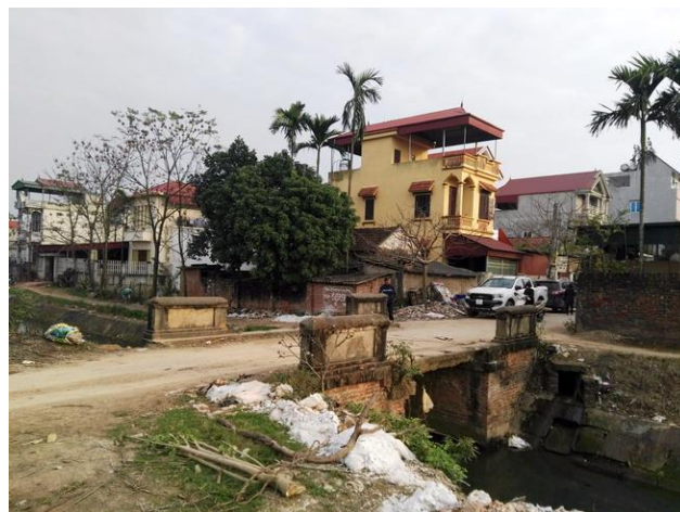
LS7 Cầu Cơ Khí