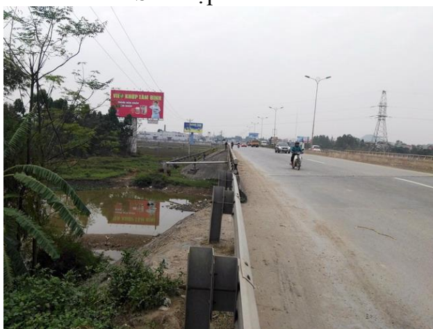
LS14 Cầu Lò Càng