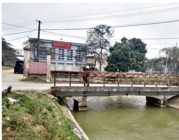
LS2 Trạm bơm Bạch Hạc