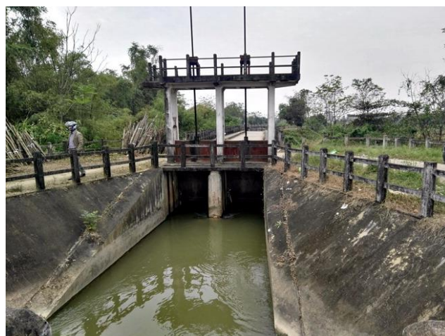
LS5 Cổng điều tiết Vũ Di