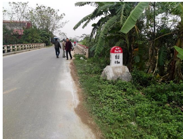
LS11 Cầu Xuân Lai