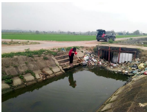
LS8 Cầu Đất