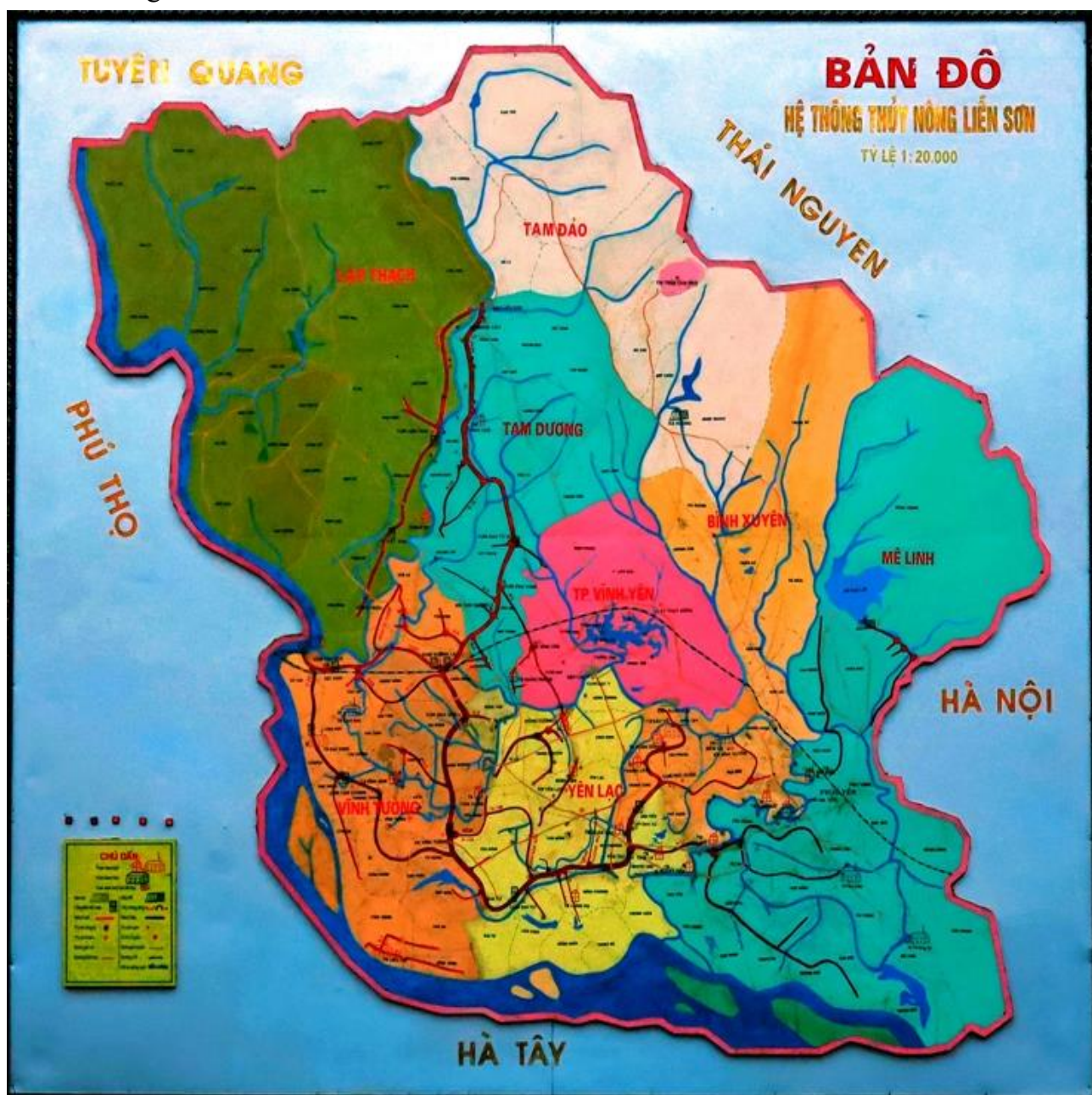
Hình 1.1: Bản đồ hệ thống thủy lợi Liễn Sơn

Hệ thống thủy lợi Liễn Sơn phía bắc giáp hai tỉnh Thái Nguyên và Tuyên Quang, đường ranh giới là dãy núi Tam Đảo; phía Tây giáp tỉnh Phú Thọ, ranh giới tự nhiên là sông Lô; phía Nam giáp Hà Nội, ranh giới tự nhiên là sông Hồng; phía Đông giáp hai huyện Sóc Sơn và Đông Anh – Hà Nội.